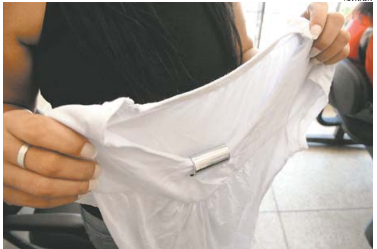
NA DELEGACIA, dona de casa segura uma blusa da filha, de 9 anos. A menina foi violentada pelo namorado da mãe

“Quando descobri, fui até a delegacia informar que ia matar o meu ex. O delegado me aconselhou a ter sangue frio”